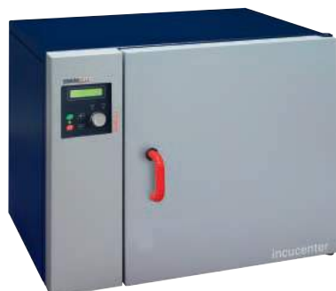
Model : IC40