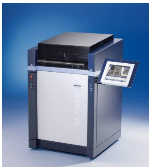
Model : S8 TIGER