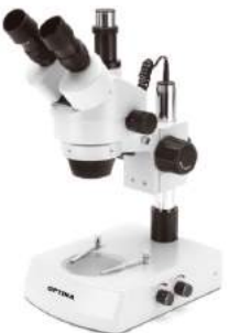
실체 현미경, 삼안