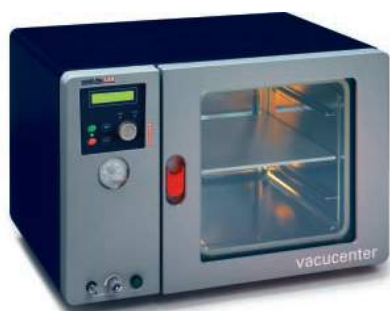
Model : VC20