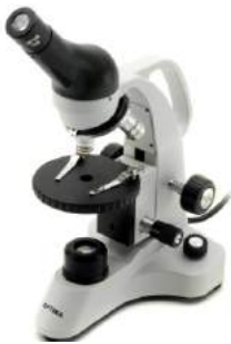
실체 현미경, 단안